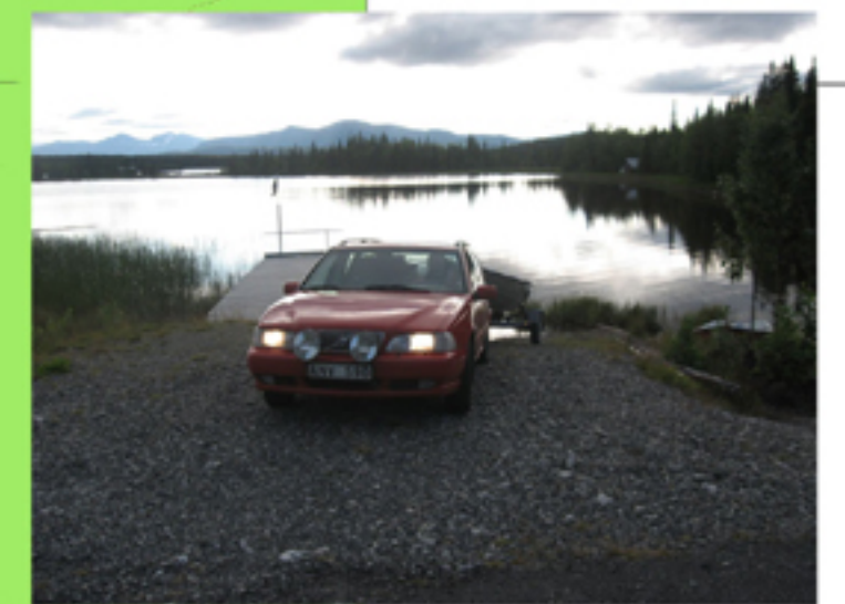
Båtnedfart vid röda punkten

Västansjön erbjuder fiske efter röding, öring och abborre. Störst chans till fångst av grov röding och öring torde finnas i Västansjön. Sedan sommaren 2005 råder totalt nätförbud i samtliga samfälliga vatten som tillhör byalaget. Fisket är upplåtet under hela året.