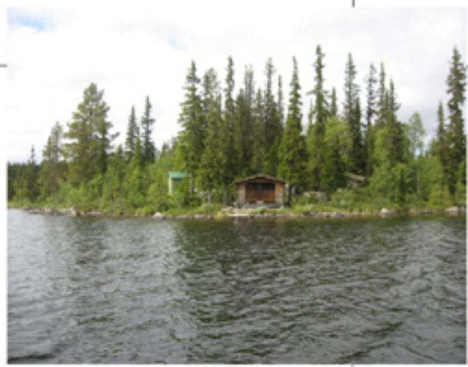
Vindskydd med eldstad samt toalett.