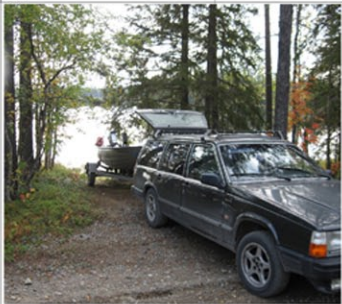
Båtnedfart finns vid Tjärnässjön nedanför Holmsjön som är sammanfogade via ett smalt sund.

Hela sjösysteme i avrinningsområdet till Mesjöbäcken består av 4 Sjöar. Tjärnässjön, Holmsjön, Bosjön samt Mesjön.