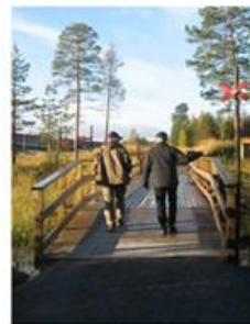
Bron över Baksjöbäcken

Baksjötjärn erbjuder främst fiske efter gädda, abborre samt utsatt större ädelfisk. Baksjötjärn är mycket grund med ett maxdjup runt 4 m vilket gör den mycket produktiv. Den har ett kvalitativt fint vatten som kommer från den tidigare vattentäkten i Vilhelmina.