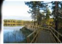
Handikappanpassad gång efter tjärnen, med 3 st bryggor och 2 vindskydd/eldstäder.