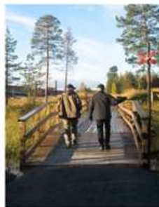
Bron över Baksjöbäcken

Handikappanpassad gång efter tjärnen, med 3 st bryggor och 2 vindskydd/eldstäder.