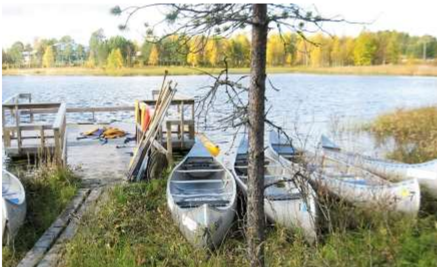
Kurs i paddling

Volgsjöns fvo kontrollerar fiskekortet under säsongen.