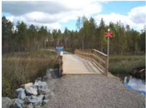
Skoterled och vandringsled

Den kanske bästa fiskeperioden infaller någon vecka före och någon vecka efter midsommar då sländorna kläcker. Sländan kläcker i stora mängder och lockar upp tjärns ädelfiskar till riktig vakfest.