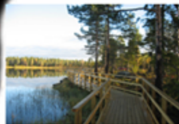
Handikappanpassad gång efter tjärnen, med 3 st bryggor och 2 vindskydd/eldstäder.