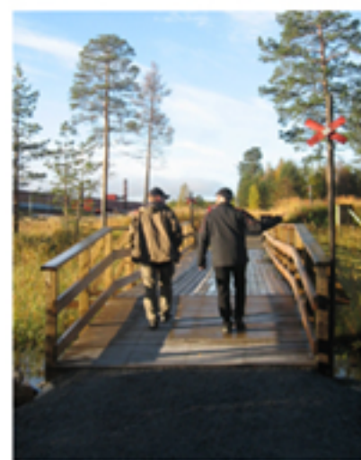
Bron över Baksjöbäcken

Baksjötjärn erbjuder främst fiske efter gädda, abborre samt utsatt större ädelfisk. Baksjötjärn är mycket grund med ett maxdjup runt 4 m vilket gör den mycket produktiv. Den har ett kvalitativt fint vatten som kommer från den tidigare vattentäkten i Vilhelmina.